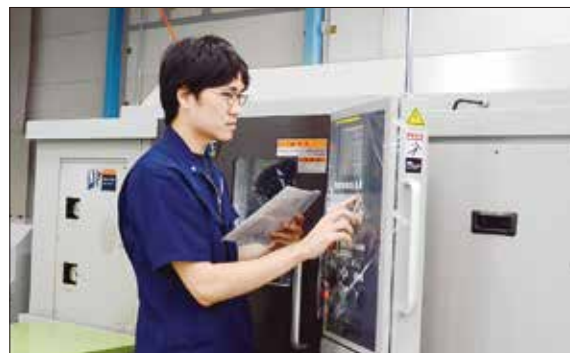
プログラムをチェックしています